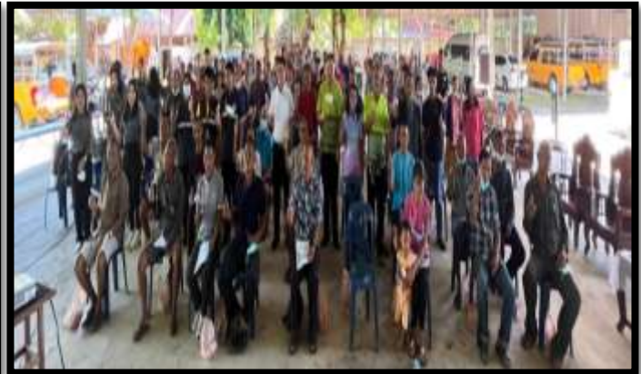
ถ่ายภาพกับผู้เข้าร่วมประชุมประชาชนมีส่วนร่วม