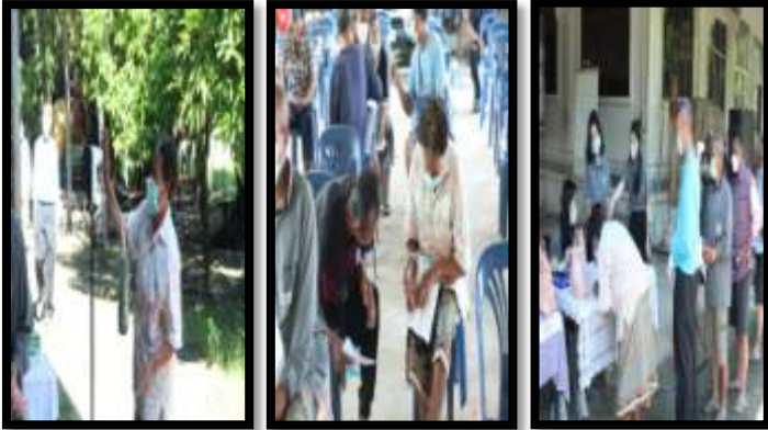
การลงทะเบียนผู้เข้าร่วมประชุม