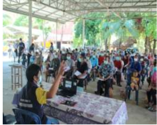
ภาพถ่ายบรรยากาศจัดประชุมการมีส่วนร่วมและรับฟังความคิดเห็นของประชาชน บรรยากาศการซักถามและแสดงข้อคิดเห็น/ข้อเสนอแนะจากผู้เข้าร่วมประชุม