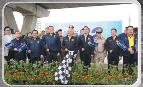
อ่านต่อหน้า 3