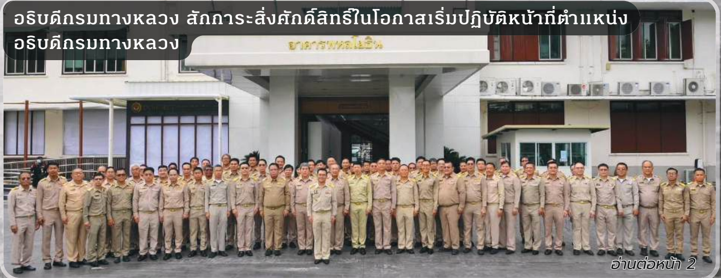
อ่านต่อหน้า 2