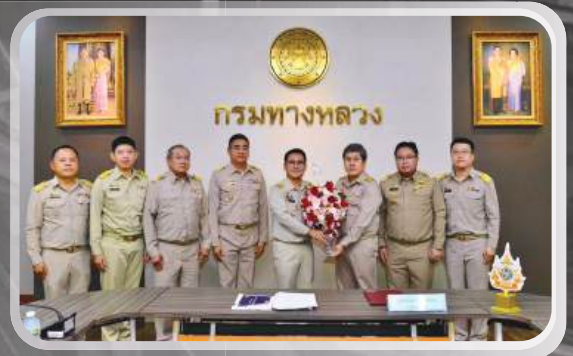
อ่านต่อหน้า 4