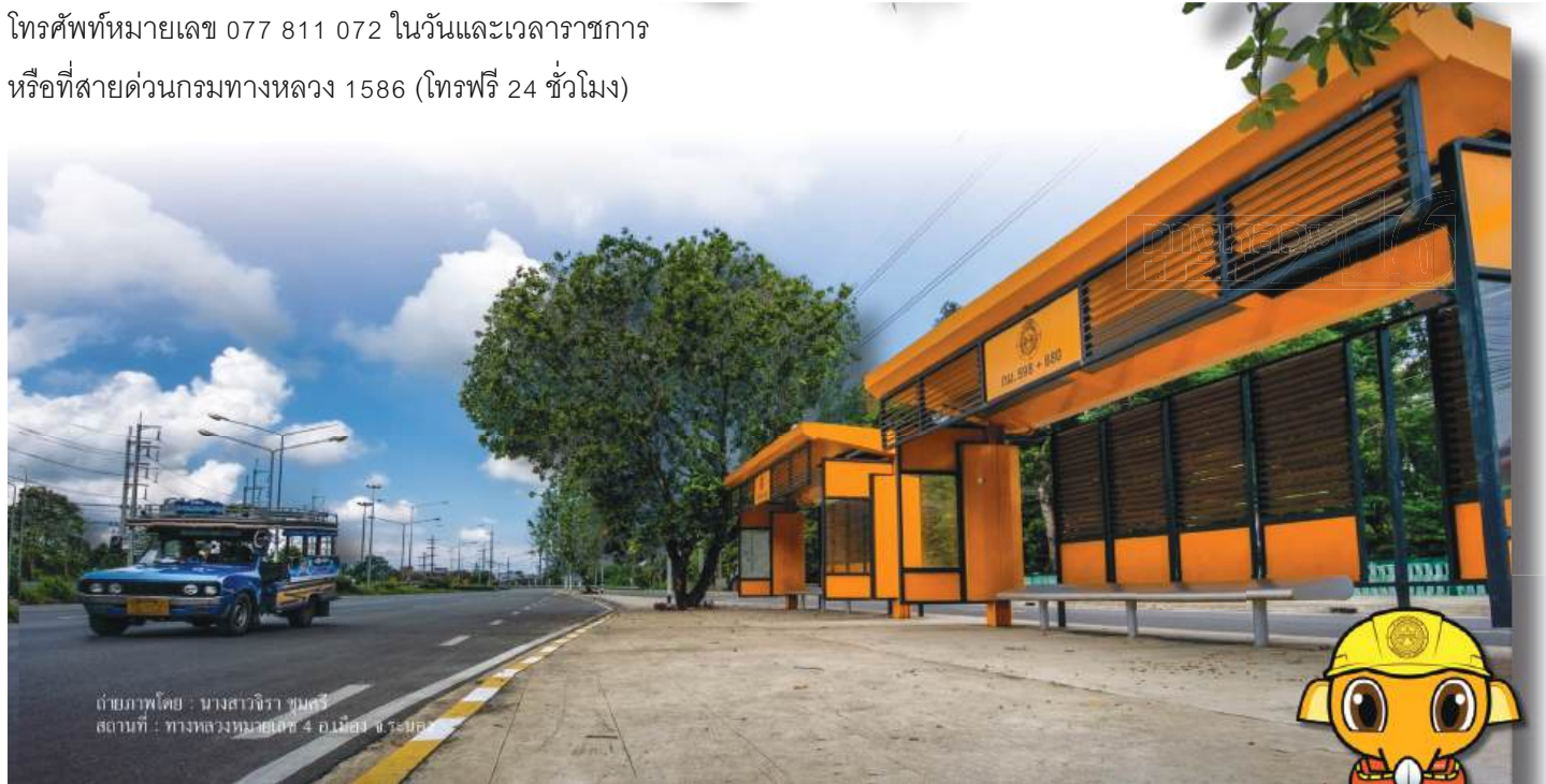
สถานที่ : ทางหลวงหมายเลข 4 อ.เมือง ระนอง

หรือที่สายด่วนกรมทางหลวง 1586 (โทรฟรี 24 ชั่วโมง)